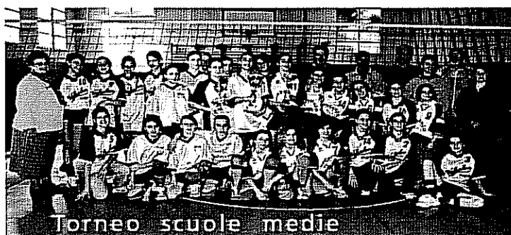
Torneo scuole medie