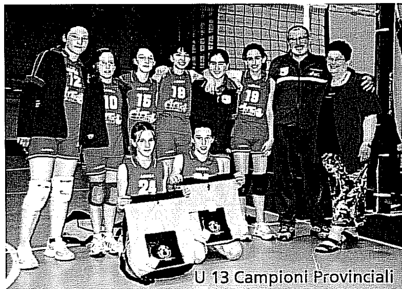
U 13 Campioni Provinciali