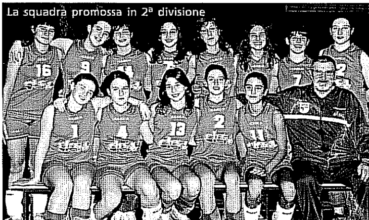
La squadra promossa in 2ª divisione

consuetudine il risultato di Forlì é di buon auspicio per la nuova annata sportiva. Dopo la "sofferta" decisione di lasciare la serie regionale il nostro impegno era rivolto a ben amministrare il settore giovanile: la gestione dei gruppi, i campionati da fare, gli allenatori, i centro di avviamento ecc.